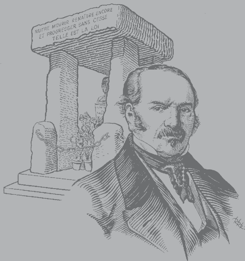
ALLAN KARDEC 3 DE OUTUBRO DE 1804 • 31 DE MARÇO DE 1869